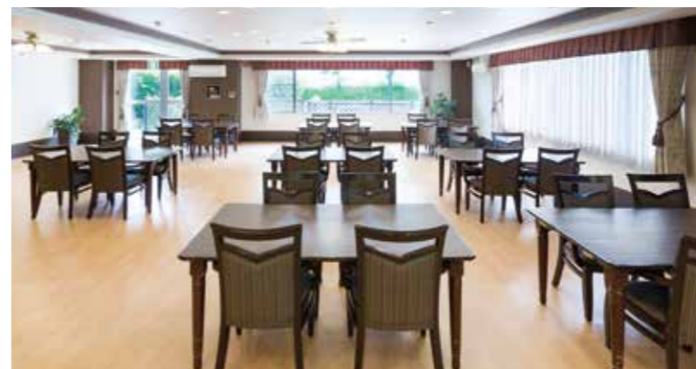
大きな窓から陽光が差し込む、明るさいっぱいのダイニング

ゆったりとしたダイニング(食堂)や思い思いに過ごせるカフェなど、日常的にゆとりと癒しを実感できる共用空間・設備をご用意しています。