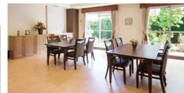
ご家族とのひとときをお楽しみいただけるファミリーダイニング

駅近の利便性と住宅地ならではの落ち着いた雰囲気と併せ持つ 光と緑に満たされた豊かな暮らし。